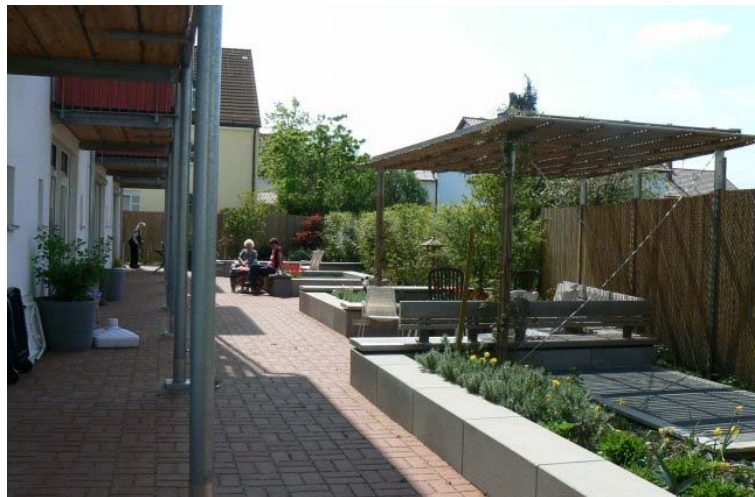
Wohngemeinschaft (EG) und Betreutes Wohnen (OG) im Neubau Heidestraße

Der Verein unterhält einen eigenen ambulanten Pflegedienst , der außer einem privaten Dienst eine Monopolstellung in der Gemeinde innehat. Der Bedarf an häuslicher Pflege hat erheblich zugenommen. 2008 werden durch die Sozialstation im ASZ pro Quartal insgesamt 29 Personen ambulant gepflegt, davon allerdings nur 10 in der eigenen Häuslichkeit (12 im Betreuten Wohnen, 7 in der Wohngemeinschaft). Auch hier arbeiten Fachkräfte des Vereins und Helfer aus der Bürgerschaft zusammen. Die ambulante Pflege wird bisher nur tagsüber angeboten (und nachgefragt). Zum Angebot häuslicher Pflege gehört ein Pflegehilfsmittel-Verleih. Die relativ geringe Zahl von Personen, die von der Sozialstation zu Hause gepflegt werden, erklärt sich teilweise aus der Konkurrenz durch Schwarzarbeit (v. a. aus Osteuropa), eventuell auch durch die Pflegeheime im Umfeld von Eching.