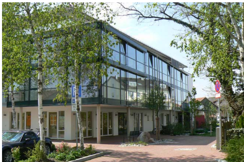
Betreutes Wohnen , Neubau Heidestraße

Neubau Heidestraße: Wegen des großen Bedarfs wird 2007 in der Nähe des ASZ eine weitere Anlage Betreuten Wohnens durch die Betreutes Wohnen Eching GmbH Co.KG als Bauträger und Vermieter fertig gestellt. Die 30 Wohnungen sind 37 - 72 m 2 groß (23 2-Zi-Whng. und 7 1-Zi-Apartments).