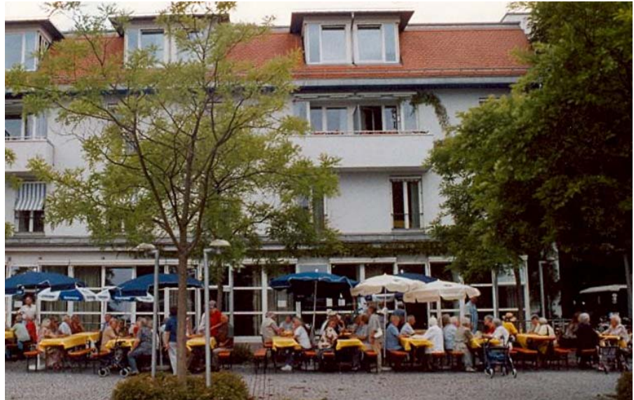
Fest im ASZ Eching

Diese Angebote wurden von Anfang an generationsübergreifend genutzt. So wurde z. B. 2000 ein Internetcafé eingerichtet. 2007 wurde das ASZ in das Programm „ Mehrgenerationenhäuser “ des Bundesfamilienministeriums aufgenommen und bietet seitdem zusätzlich familienorientierte Begegnungsmöglichkeiten, so z. B. einen „girl’s club“, Babymassage oder Kinderturnen.