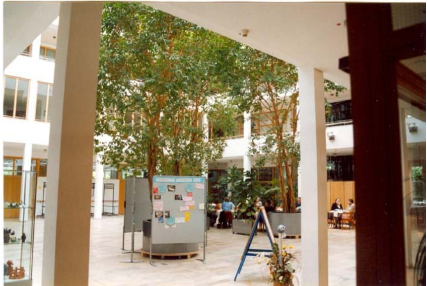
Überdachter Innenhof des ASZ Eching

Neubau Heidestraße: Wegen des großen Bedarfs wird 2007 in der Nähe des ASZ eine weitere Anlage Betreuten Wohnens durch die Betreutes Wohnen Eching GmbH Co.KG als Bauträger und Vermieter fertig gestellt. Die 30 Wohnungen sind 37 - 72 m 2 groß (23 2-Zi-Whng. und 7 1-Zi-Apartments).